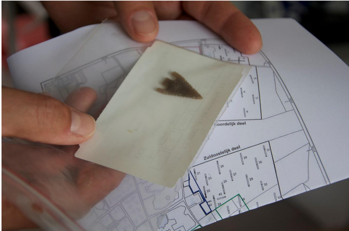
Foto: om goed specialistisch onderzoek mogelijk te maken is het belangrijk dat anorganisch vondstmateriaal tijdens opgravingen zorgvuldig verzameld wordt