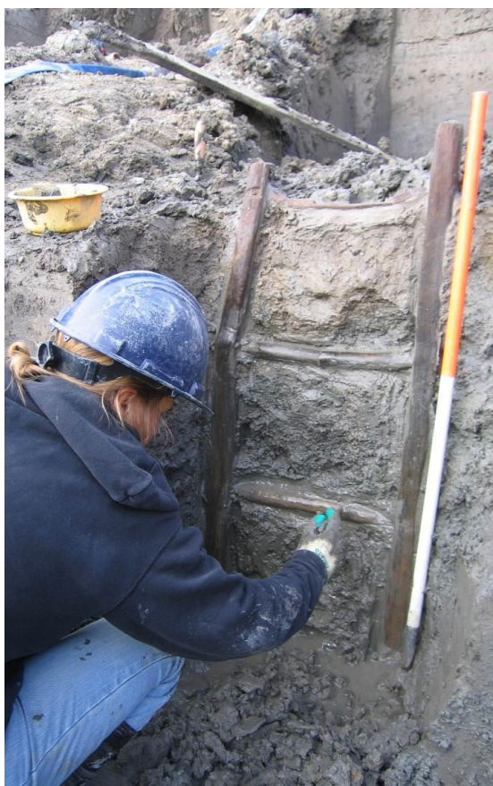
Foto: hoewel hout in het veld zichtbaar is, zoals de hier gefotografeerde Romeinse ladder van tenminste 110 cm lengte, is een microscoop nodig om te achterhalen uit welke houtsoorten deze bestaat

Als er bij een activiteit geen actor of specificatie is opgenomen, dan zijn hieraan geen nadere eisen gesteld anders dan het uitvoeren van de bijbehorende procedure / beschrijving.