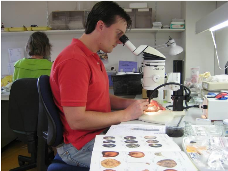
Foto: opvallend-lichtmicroscop met vergroting tot 50x, een lichtbron met koud licht en flexibele lichtpunten, voor analyse van botanische macroresten

Tot slot kan het bevoegd gezag Wabo aan de vergunning een voorschrift verbinden ten aanzien van de vereiste archeologische maatregelen.